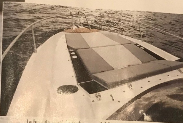
Le bord de cockpit de ce modèle mesure 2,15 mètres de long et 1,66 mètre de large. Les surfaces noires sont antidérapantes.