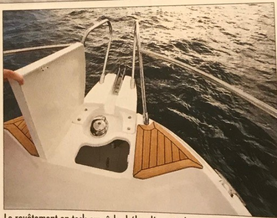
Le revêtement en teck empêche hélas d'ouvrir davantage le capot de la baille à mouillage.

Les commandes électriques NHK montées en option (2 500 € environ) rendaient le pilotage plus doux ; elles réclament cependant un réglage précis afin de pouvoir bien synchroniser le régime des deux moteurs. Le système de banquette coulissante a tendance à bouger en situation de navigation rapide dans le clapot, et il faudrait améliorer son verrouillage. À la barre, pilote et copilote profitent d'un traitement royal, installés dans un confortable fauteuil enveloppant avec accoudoir central sous lequel se trouve un vide-poche intégrant une astucieuse prise USB. La planche de bord sur deux niveaux permet l'ins-