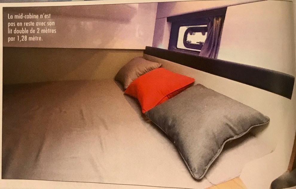
La mid-cabine n'est pas en reste avec son lit double de 2 mètres par 1,28 mètre.

teck dont les bords sont gainés de simili cuir, et autour de laquelle quatre ou cinq personnes peuvent s'installer. En face du petit bar, le cabinet de toilette correctement dimensionné offre une hauteur sous barrots de 1,69 mètre. L'ambiance y est chic et il est possible de prendre une douche grâce au flexible intégré au mitigeur du lavabo. Au chapitre du farniente, le SL 800 sait fourbir ses armes avec un grand solarium avant de 2 mètres par 1,20 mètre, avec dossier inclinable et bimini escamotable. Le bain de soleil arrière est plus petit (1,75 x 1,02 m). ■