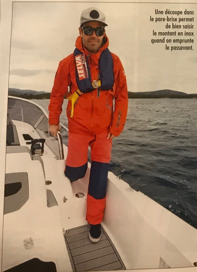
Une découpe dans le pare-brise permet de bien saisir le montant en inox quand on emprunte le passavant.