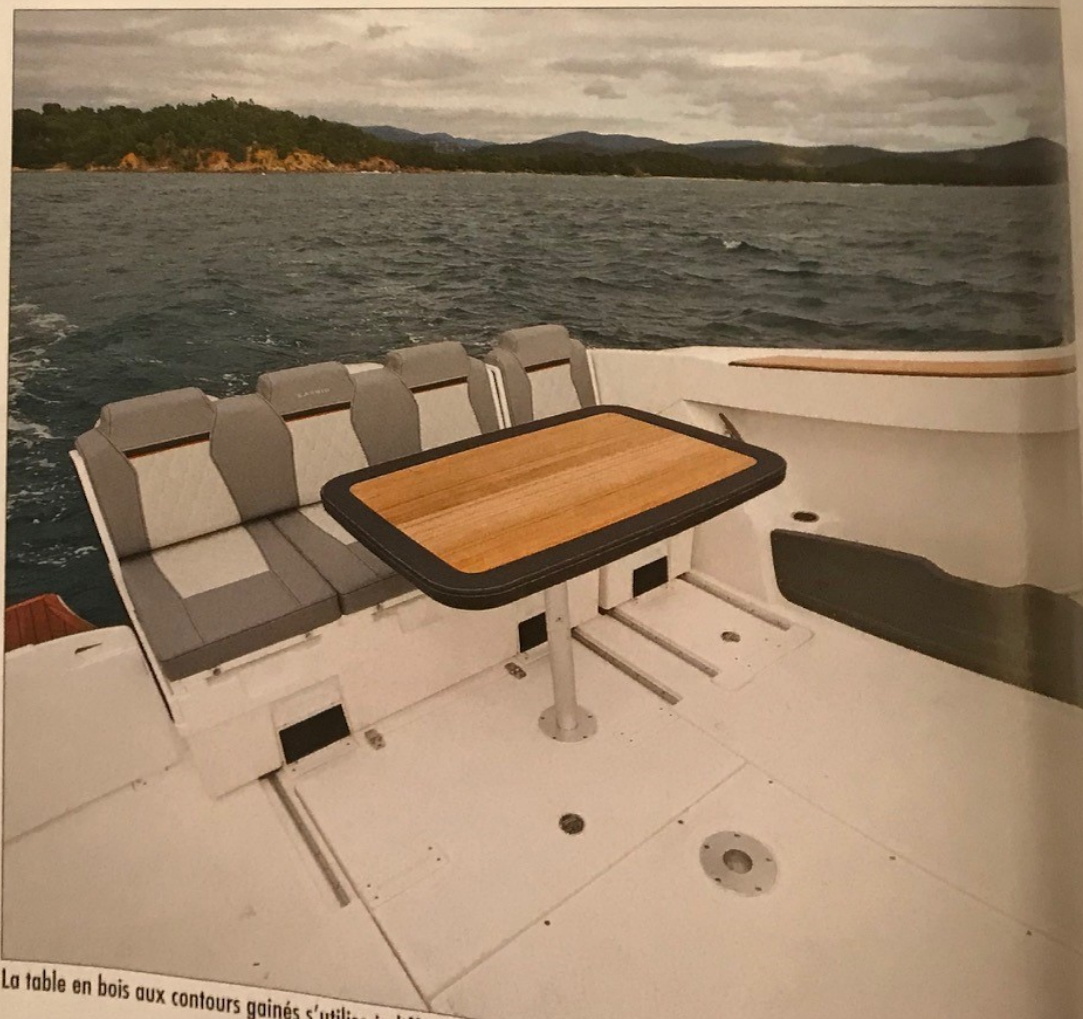
La table en bois aux contours gainés s'utilise indifféremment dans le cockpit

Nous avons essayé cette unité plutôt familiale équipée de la puissance maximale, une paire de Selva de 250 chevaux basée sur le V6 Yamaha de 3,3 litres, de quoi conférer à ce cabinier aux abords tranquilles un tempérament musclé ! Nous avons dépassé 45 nœuds en pointe, avec un équipage de cinq personnes. Certes, une paire de F200 ou de F225 devrait largement faire l'affaire, mais il est plaisant sur