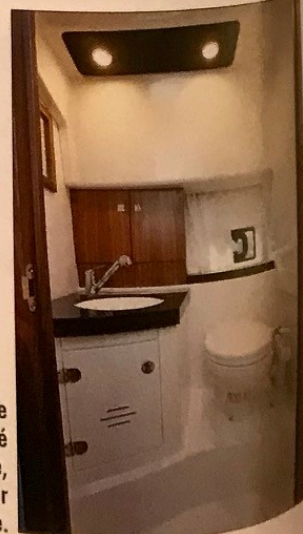
Le cabinet de toilette offre la possibilité de prendre une douche, avec une hauteur de 1,69 mètre.

Karnic peut se vanter d'avoir conçu un cabin-cruiser original et bien fini, dont les idées créatives révèlent une vraie connaissance des plaisanciers. Il y a fort à parier que nombre d'entre elles seront reprises par la concurrence !