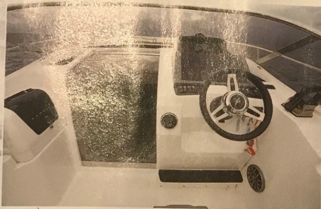
Commandes électriques, volant réglable et grande planche de bord caractérisent le poste de barre.