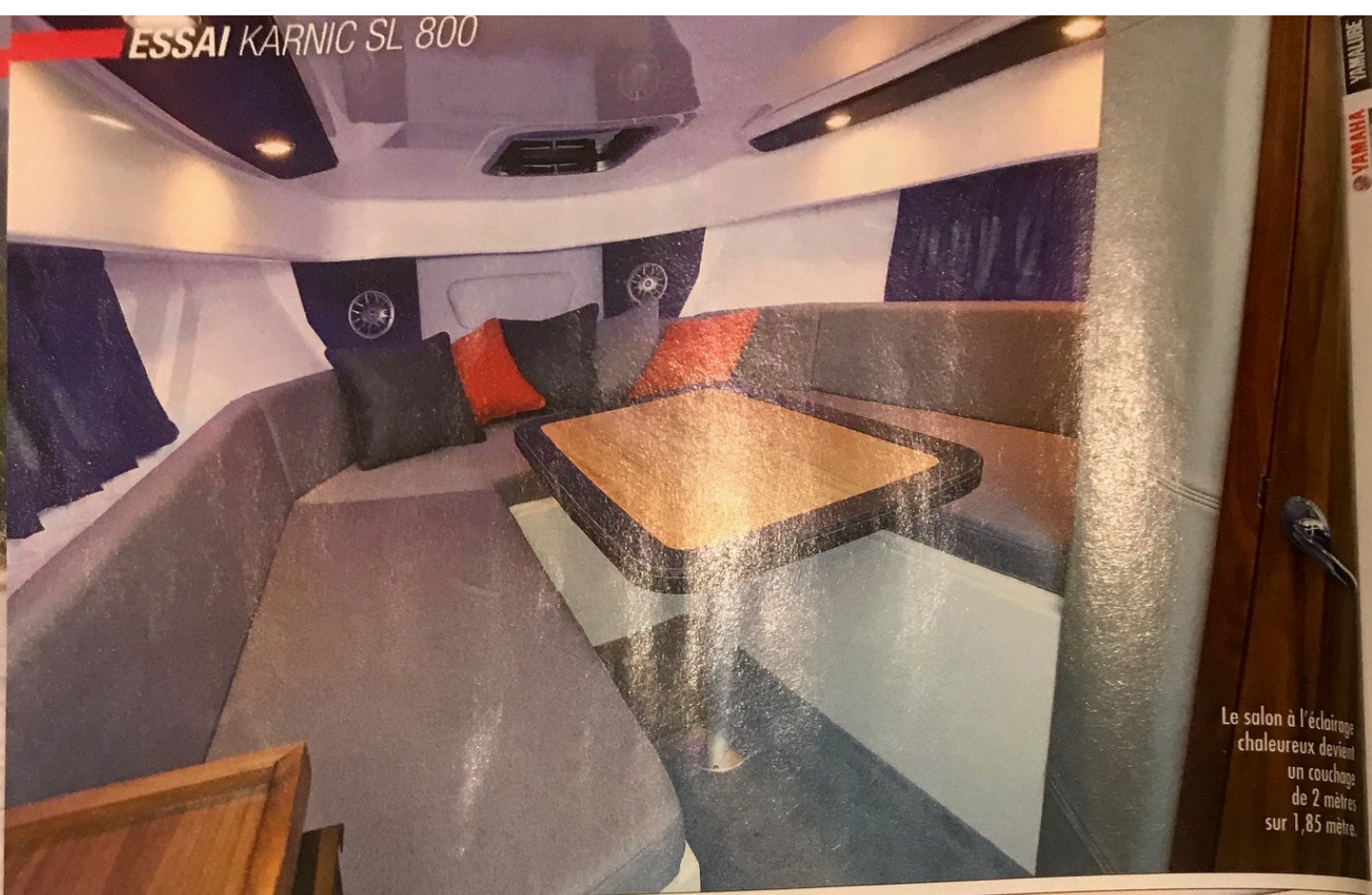
Le salon à l'éclairage chaleureux devient un couchage de 2 mètres sur 1,85 mètre.

tallation d'un écran multifonction jusqu'à 12 pouces, avec éventuellement l'écran Command Link affichant les données propres aux moteurs au-dessus. Le volant inclinable et l'assise relevable des fauteuils permettent d'ajuster au mieux la position de pilotage. Globalement, le haut pare-brise enveloppant avec son armature en inox abrite bien la cellule de pilotage. Les rangements sont présents en nombre à bord, et de tailles variées. Le plus étonnant est peut-être la cantine portable, encastrée dans le pavois à côté du copilote, et qu'il est possible de rapporter chez soi pour préparer une trousse médicale d'urgence par exemple.